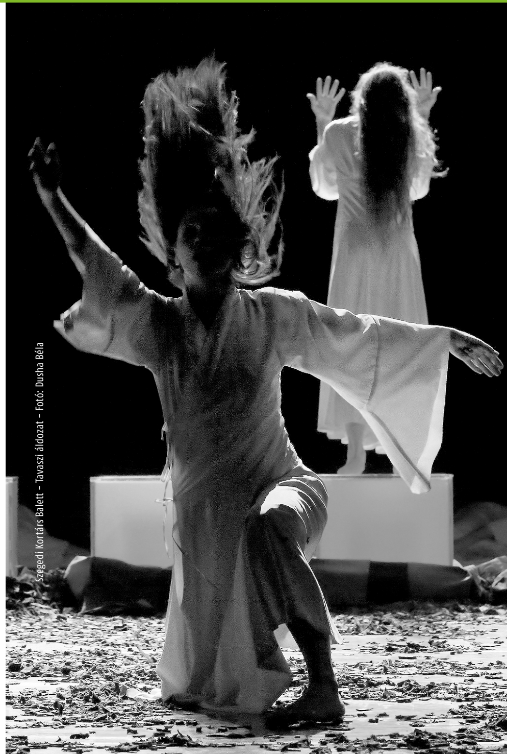
Szegedi Kortárs Balett – Tavaszi áldozat

People who live in the detritus of their own pasts dwell side by side together together in a community where their only real aim is to exist, closed off, inside themselves. They themselves have no idea where all of this is going, but the hopelessness is growing more and more unbearable: they have to reach a decision together to rip the shell of permanence so that they can break out into another existence. It is a painful realisation that the creation of this new and better world requires a shared sacrifice. We can now see Stravinsky's "rite" reconceived from the perspective of the 21st century: what might redemption, sacrifice and being sacrificed mean to people of today? A community that is slowly consuming itself eliminates the past, but with no vision for the future to replace it, there is nothing left for them to do but prove the meaning of their existence and death by sacrificing themselves.