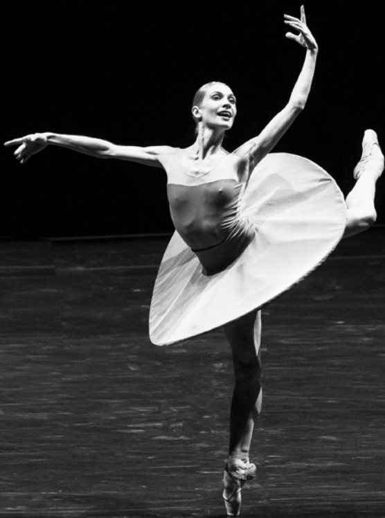
Magyar Nemzeti Balett – A tökéletesség szédítő ereje